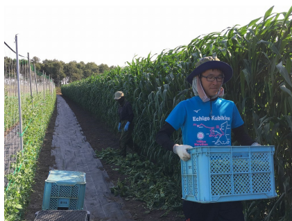
↑ スイートコーンの収穫作業