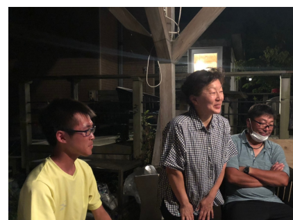
↑ 地域農家との交流会