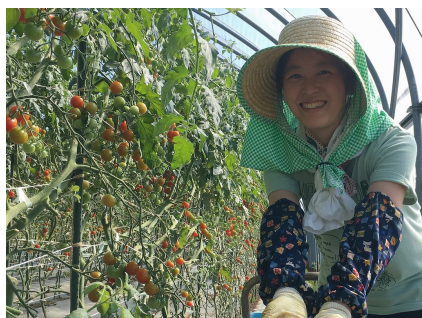
↑ ミトマトの収穫作業