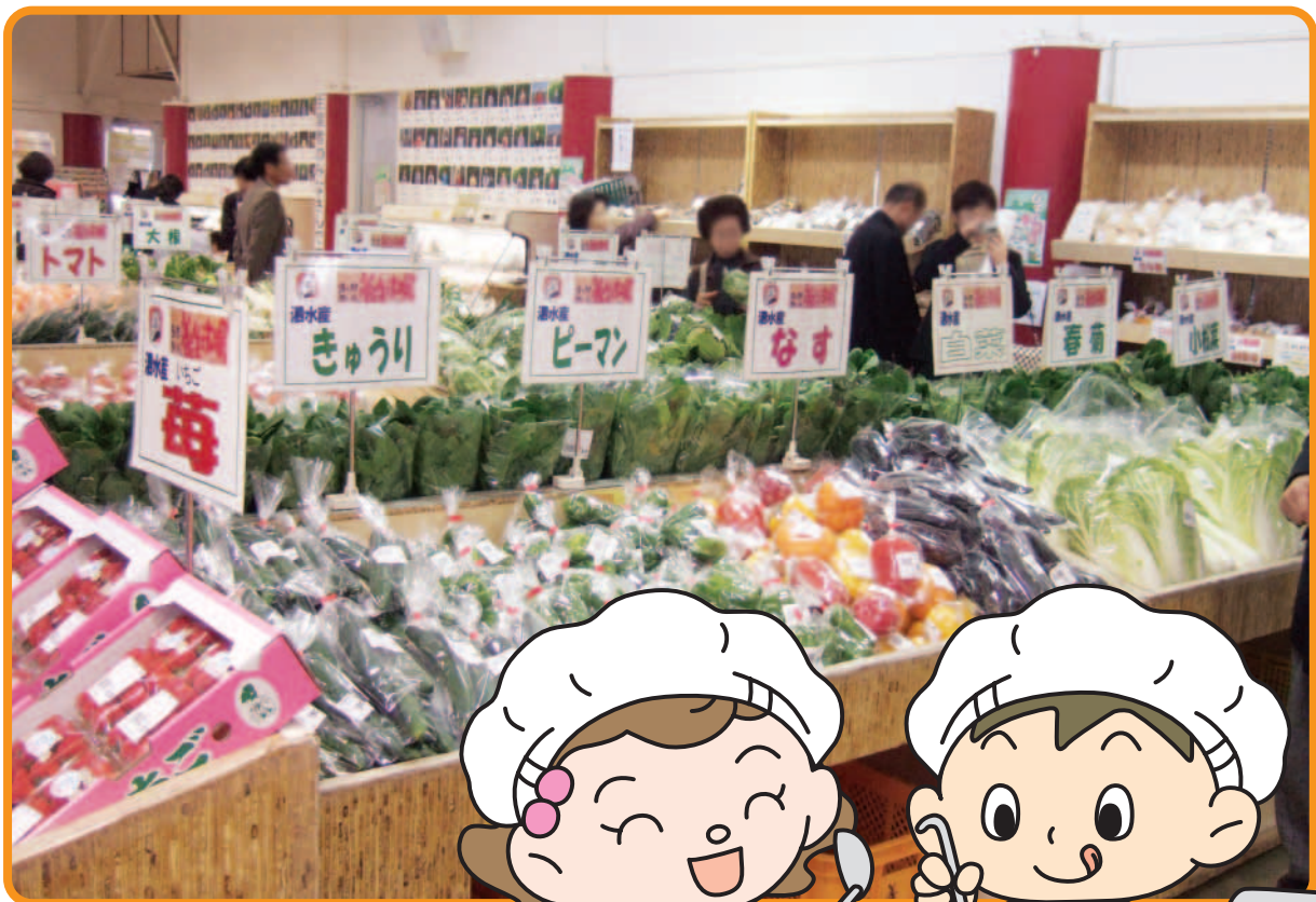
ようじょういち ば 養生市場店内 (熊本県菊池市泗水町)