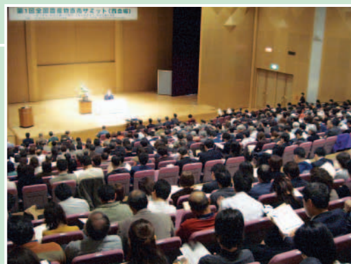
西会場の様子・平成18年2月14日(熊本市) 550名参加

平成17年度に全国初の直売活動の実践者・支援者を対象としたサミットを東西2会場で開催(東:千葉県八千代市、西:熊本県熊本市)。食育活動や給食への食材供給の展開方策に関する実践報告や意見が交わされた。また、直売活動の発展に向けて品揃えに向けた工夫、地域性や旬へのこだわり、生産者の意識向上、直売店の社会的責任などが確認された。