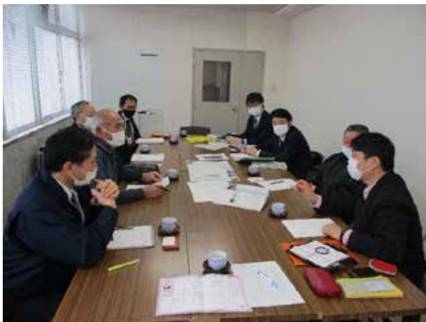
関係者間での顔合わせ、合意形成