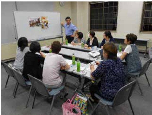
イベント等の検討の研修会