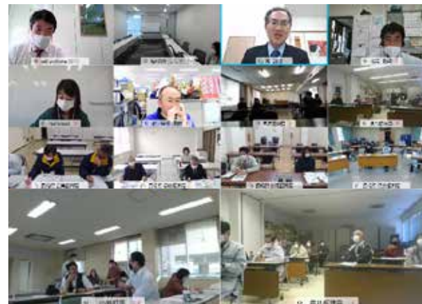
オンラインでの開催の様子