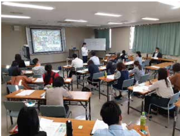
セミナーの開催の様子