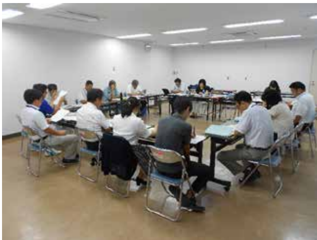
事業内容、進め方の検討