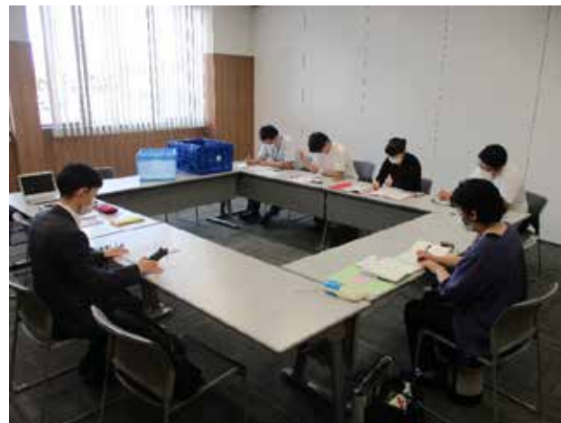
運行要領やルールの検討