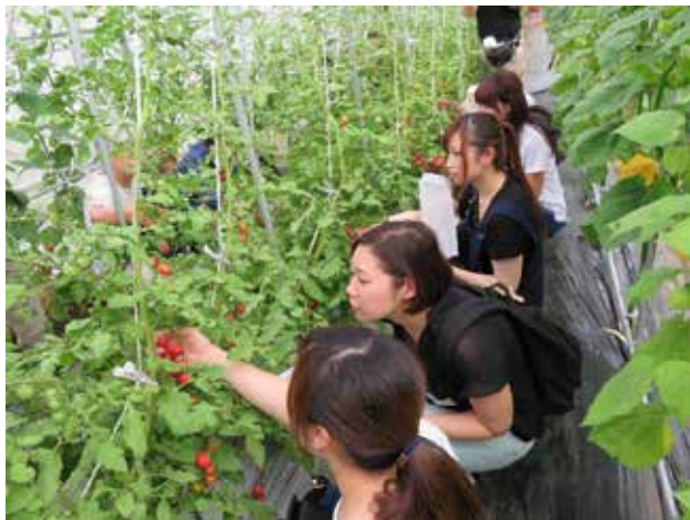
体験活動の様子（トマト栽培）