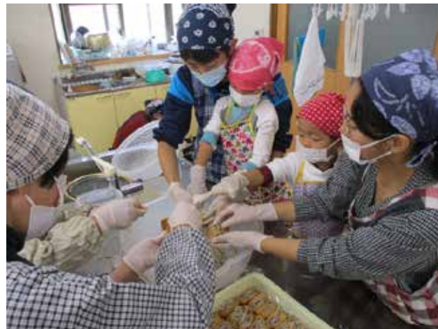
体験活動の様子（そば寿司）