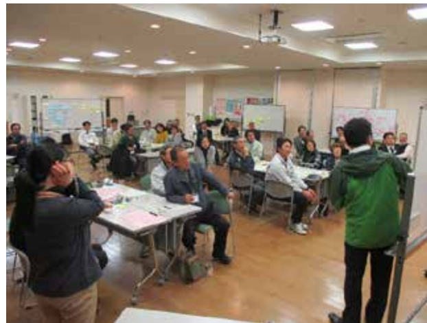
市民参加によるWSの開催の様子