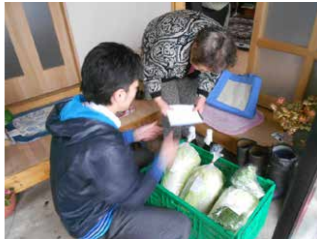
高齢農家宅への集荷