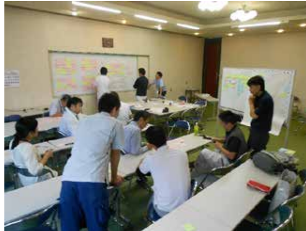
将来ビジョン実現手法の検討