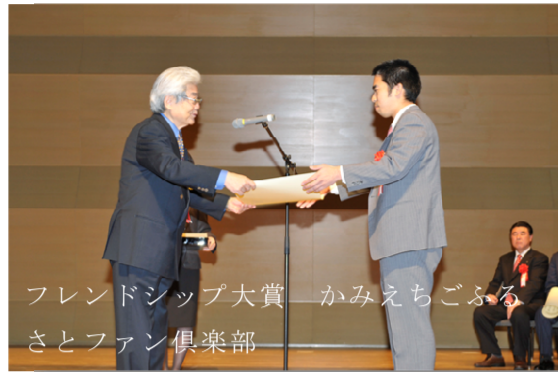
フレンドシップ大賞—かみえちごふるさとファン倶楽部