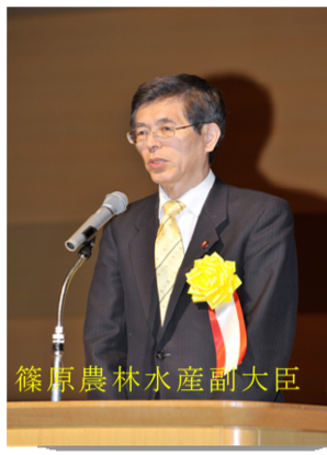
篠原農林水産副大臣