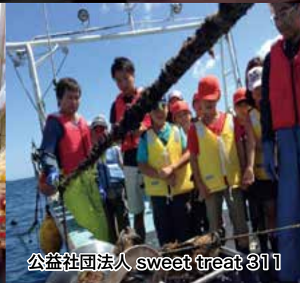
公益社団法人 sweet treat 311