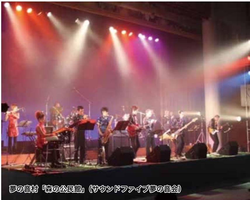
夢の音村「森の公民館」(サウンドファイブ夢の音会)