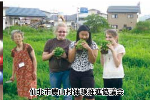
仙北市農山村体験推進協議会