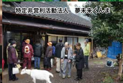
特定非営利活動法人 夢未来くんま