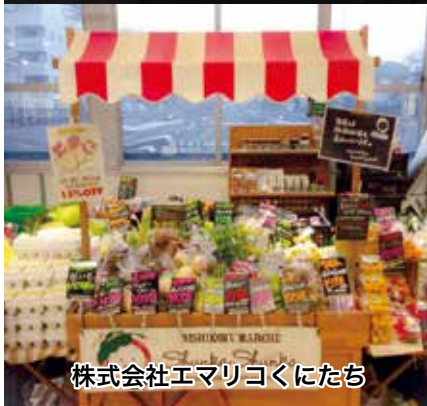
株式会社エマリコくにたち