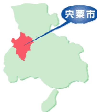
図1 宍粟市の位置

宍粟市は、兵庫県中西部に位置し、2008年に4町（山崎町、一宮町、波賀町、千種町）が合併しました。人口は41,635人（2013年7月現在）、世帯数は約14,000世帯の自治体です。大部分を山地が占めており、標高1,000m級を超える山々がそびえ、氷ノ山後山那岐山国定公園や音水ちくさ県立自然公園に属する緑豊かなまちです。第1次産業に携わる人口比は、2.38%で、農業就業人口比は1.81%です。旧山崎町や旧一ノ宮町には、木材市場もあり、市も「新・森のまち」宣言をして、森とともに生きるまちづくりを目指しています。