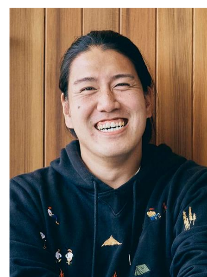
活躍されている地域おこし協力隊OB・OGの認定者