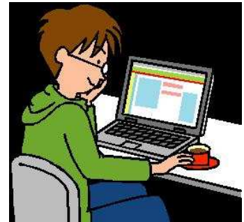
パソコンでムービーに編集して動画を作成