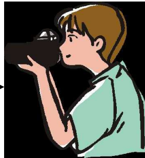
デジタルカメラ等で撮影して