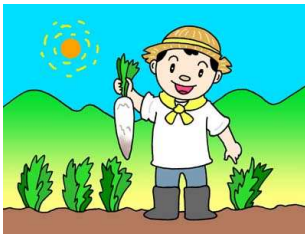
農山漁村の魅力的な体験等を