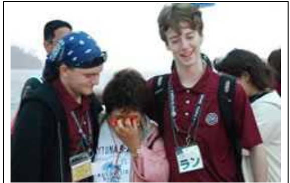
平成20年度オーライ!ニッポン大賞グランプリ NPO法人おぢかアイランドツーリズム協会

(応募・お問い合わせ先 地域活性化部 E-mail info@ohrai.jp)