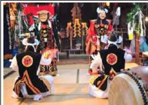
広島県庄原市 / 古事記 夜神楽

グリーン・ツーリズム商品コンテストには、全国各地よりあわせて66件のご応募をいただきました。ありがとうございました。このたび、審査委員会における厳正な審査の結果、優秀賞5点が下記のとおり決定しました。詳細はオーライ!ニッポンのwebサイトをご覧ください。